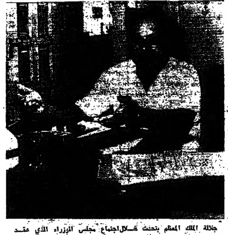
جلالة الملك المعظم يتحدث خلال اجتماع مجلس الوزراء الذي عقد برئاسة جلالة الملك الحسين في ١١ ربيع الثاني سنة ١٣٨٨ هـ الموافق ٢٥ تموز سنة ١٩٦٨ م رقم العدد ٤٦٥

في اجتماع مجلس الوزراء ترأسه الحسين إعفاء طراري قيادة لثورة هلول نزيه لآزمة المياه باريد وعان - استع طليك لقرار الرفاعي عمان - شرف جلالة الملك الحسين المعظم ، بصحبه سمو الأمير حسن ولي العهد المعظم برئاسة الوزراء بزيارة كريمة حيث ترأس جلسته مجلس الوزراء الساعة الثالثة من بعد ظهر أمس واستمر جلسته مع دولة السيد بهجت الطنوني رئيس الوزراء بالوزراء في هذه الجلسة التي استغرقت حوالي الثلاث ساعات مختلف الشؤون المتعلقة بما قامت به وزارات المختصة من اجراءات تنفيذ الطلبات التي تقدمت بها المحافظات الى تنفيذ خلال الزيارات التي قام بها مؤخرا . البقية على الصفحة الثانية عمود ٥